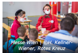
Messe Wien