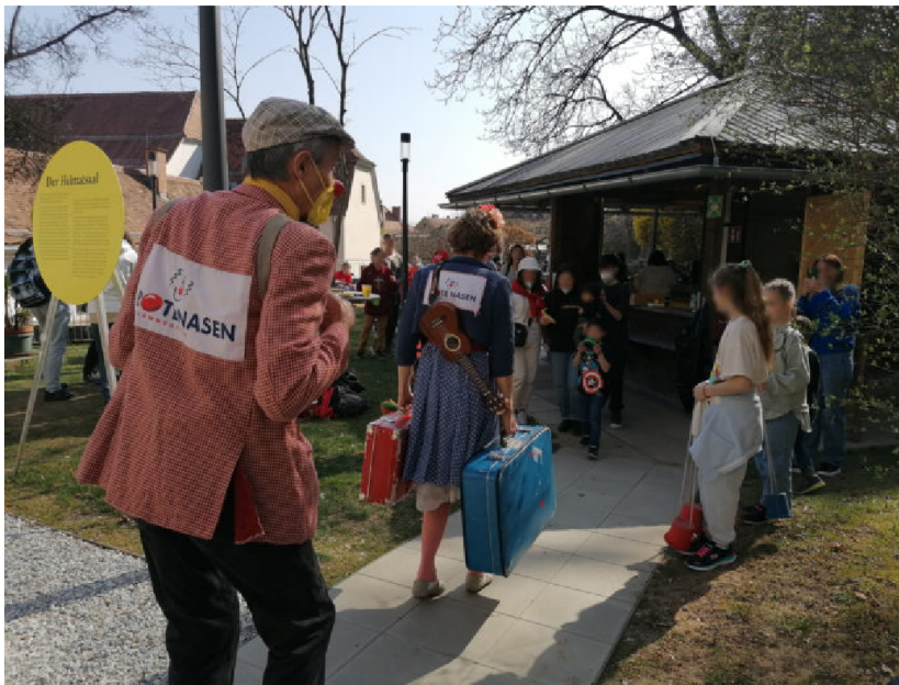
Graz, Steiermark | ©Rote Nasen

ROTE NASEN Österreich besuchen im Rahmen von „Emergency Smile“ in mittlerweile vier Bundesländern geflüchtete Kinder und Erwachsene aus der Ukraine in Ankunftszentren und Unterkünften. Der Weltlachtag am 1. Mai 2022 hebt die Bedeutung des Lachens für das seelische Wohlbefinden hervor.