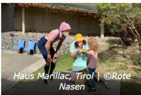
Haus Marillac, Tirol