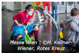
Messe Wien