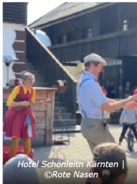
Hotel Schönleitn Kärnten